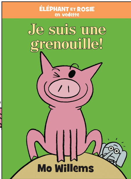
Illustration tirée de Éléphant et Rosie : Je suis une grenouille! © Mo Willems.